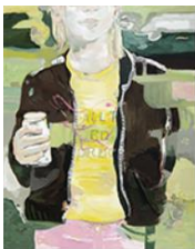
VERDURE , 2015 Huile sur toile 160 x 130 cm