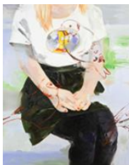
VERDURE , 2015 Huile sur toile 160 x 130 cm