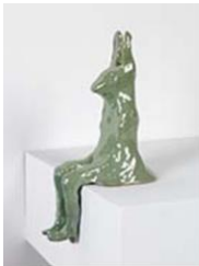
LAPIN TÉMOIN , 2013 Céramique 38 x 17 x 17 cm