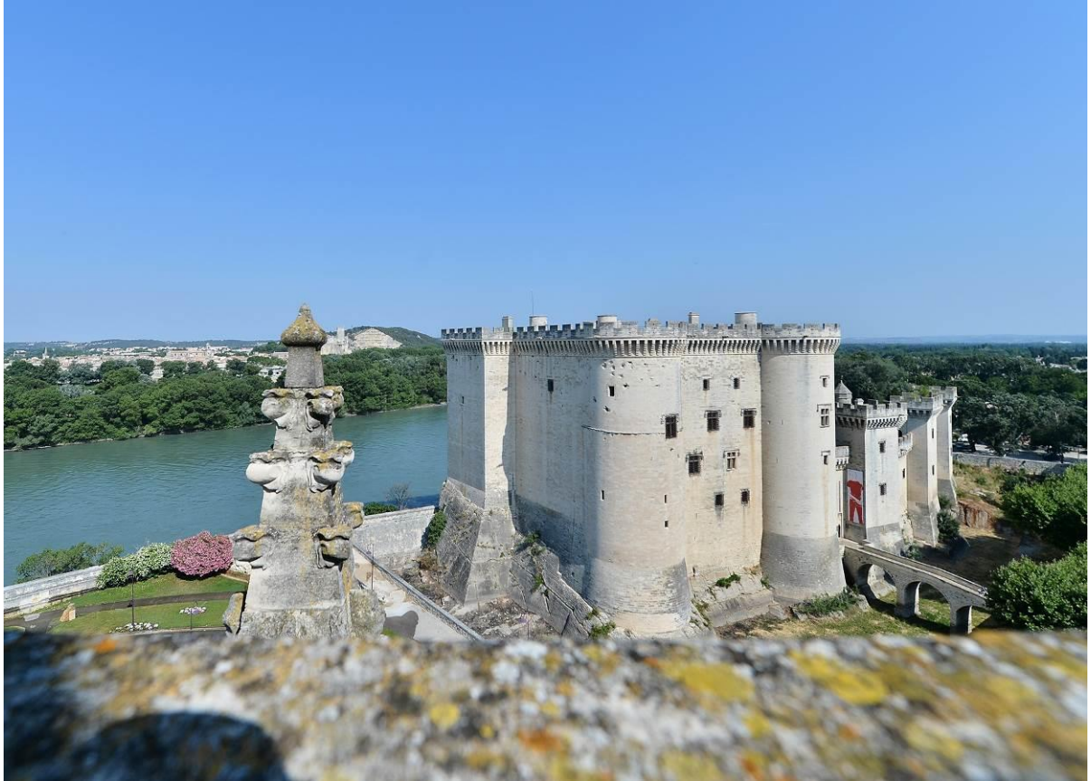
Le Château de Tarascon – Centre d'art René d'Anjou. La porte du château est ornée d'un dessin de Françoise Péetrovitch réalisé en 2013, Ulysse .