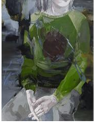
VERDURE , 2015 Huile sur toile 160 x 130 cm