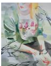
VERDURE , 2014 Huile sur toile 160 x 130 cm