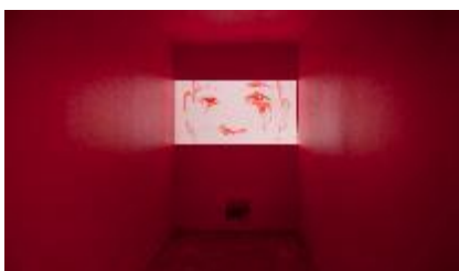
LE LOUP ET LE LOUP , 2011 Vidéo numérique 4 min 44 sec. en boucle