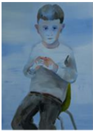
SANS TITRE , 2012 Huile sur toile 80 x 60 cm