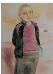
LA CHANTEUSE , 2012 Huile sur toile 195 x 130 cm