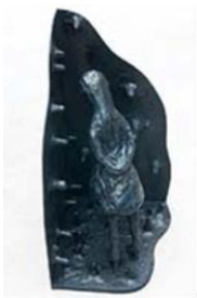
PRESENCE IN THE CORNER , 2010 Bronze 87 x 50 cm