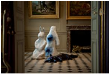
LE RENARD DU CHESHIRE , 2007 Grès émaillé, trois éléments, Manufacture Nationale de Sèvres 3 x (112x 140 x 140 cm)