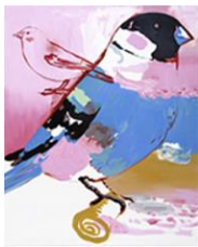
VERDURE , 2016 Huile sur toile 160 x 130 cm