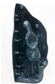
PRESENCE IN THE CORNER , 2010 Bronze 87 x 50 cm