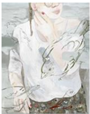
VERDURE , 2015 Huile sur toile 160 x 130 cm