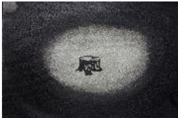
AU PLUS PRÈS DE LA FORÊT , 2016 Vidéo