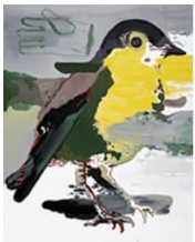
VERDURE , 2016 Huile sur toile 160 x 130 cm