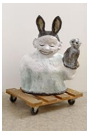
VENTRILOQUE , 2015 Grès émaillé et palette en bois 103 x 80 x 50 cm