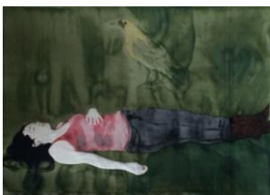
de la série ÉTENDU , 2015 Tapisserie 180x270 cm