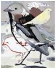
VERDURE , 2016 Huile sur toile 160 x 130 cm