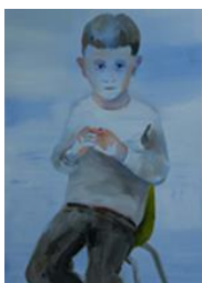
SANS TITRE , 2012 Huile sur toile 80 x 60 cm