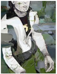
VERDURE , 2015 Huile sur toile 160 x 130 cm