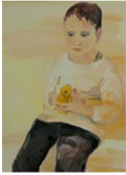
GARÇON AU POUSSIN , 2012 Huile sur toile 80 x 60 cm