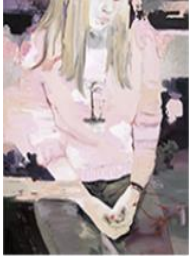
SANS TITRE , 2015 Huile sur toile 160 x 130 cm