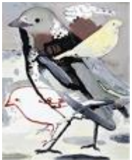
VERDURE , 2016 Huile sur toile 160 x 130 cm