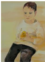
GARÇON AU POUSSIN , 2012 Huile sur toile 80 x 60 cm