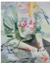
VERDURE , 2014 Huile sur toile 160 x 130 cm