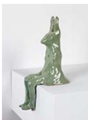
LAPIN TÉMOIN , 2013 Céramique 38 x 17 x 17 cm