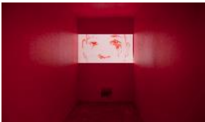
LE LOUP ET LE LOUP , 2011 Vidéo numérique 4 min 44 sec. en boucle