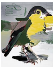
VERDURE , 2016 Huile sur toile 160 x 130 cm