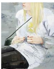
VERDURE , 2016 Huile sur toile 160 x 130 cm