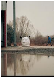
JANUS , 2006 Grès émaillé H: 95 cm