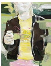
VERDURE , 2015 Huile sur toile 160 x 130 cm