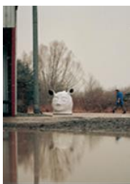
JANUS , 2006 Grès émaillé H: 95 cm