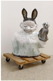
VENTRILOQUE , 2015 Grès émaillé et palette en bois 103 x 80 x 50 cm